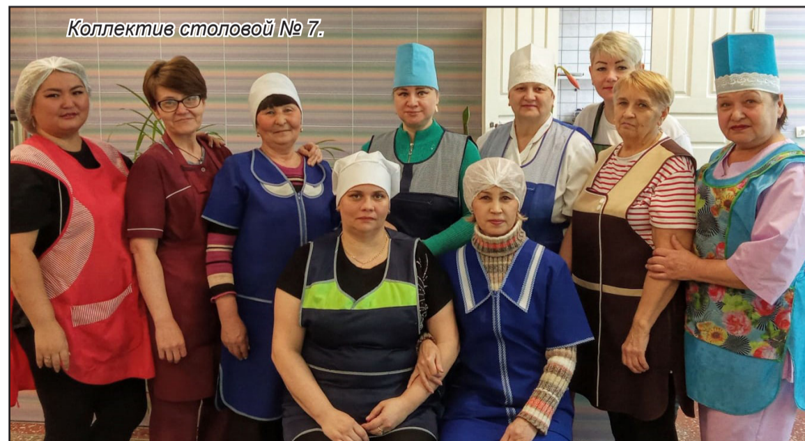
Коллектив столовой № 7.