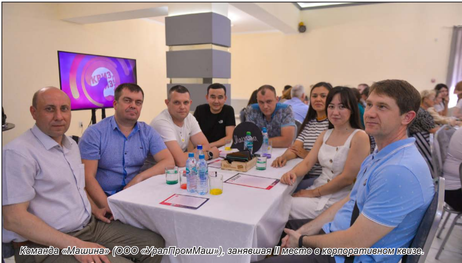
Команда «Машина» (ООО «УралПромМаш»), занявшая III место в корпоративном квизе.

Определились победители и призёры семейных состязаний «Мама, папа, я – спортивная семья». Подробнее на 5 стр.