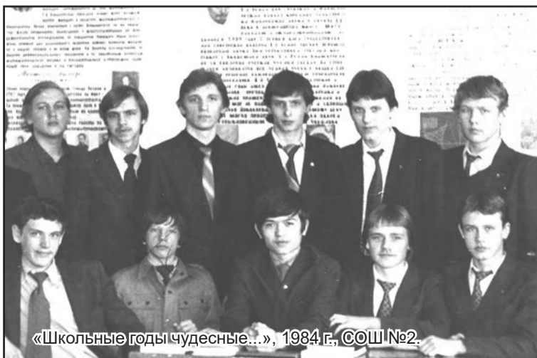
«Школьные годы чудесные...», 1984 г., СОШ №2.