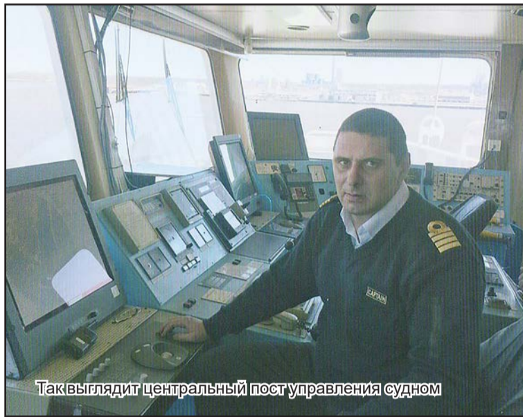
Так выглядит центральный пост управления судном

После окончания Одесского мореходного училища по рас-