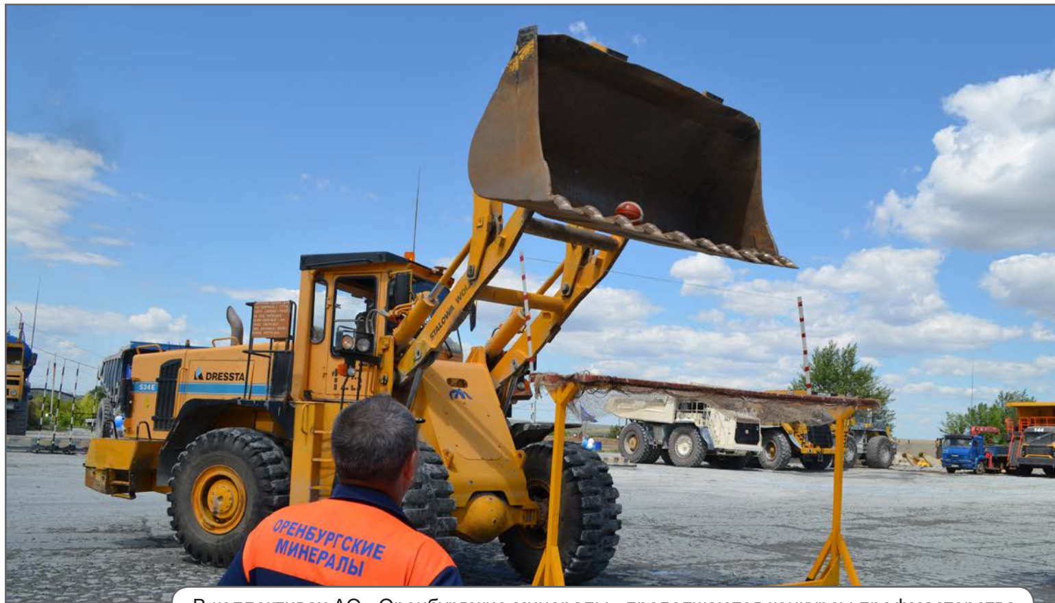
В коллективах АО «Оренбургские минералы» продолжаются конкурсы профмастерства.

Как граффити в городе вдохновило детей на творчество. Подробнее на 7 стр.