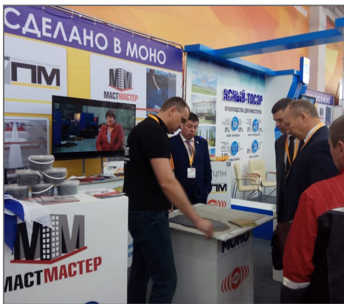
форума «Оренбуржье – сердце Евразии», в Новотроицке один из резидентов – Новотроицкий содовый завод, запустил на своём предприятии первую линию.

В Оренбургской области сегодня статус ТОСЭР имеют два моногорода: Ясный и Новотроицк. В Ясном вместе с новым будут работать семь резидентов. В Новотроицке работают пять. 21 ноября, в день открытия Международного