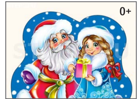
График проведения новогодних мероприятий для детей работников комбината

Утренники в ФОК «ОМ Арена» (дети от 0 до 7 лет)