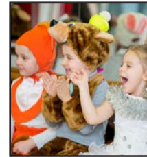
График проведения новогодних мероприятий для детей работников комбината. Подробнее на 7 стр.

Учебный центр о профессиональном обучении работников комбината в уходящем 2019 году. Подробнее на 7 стр.