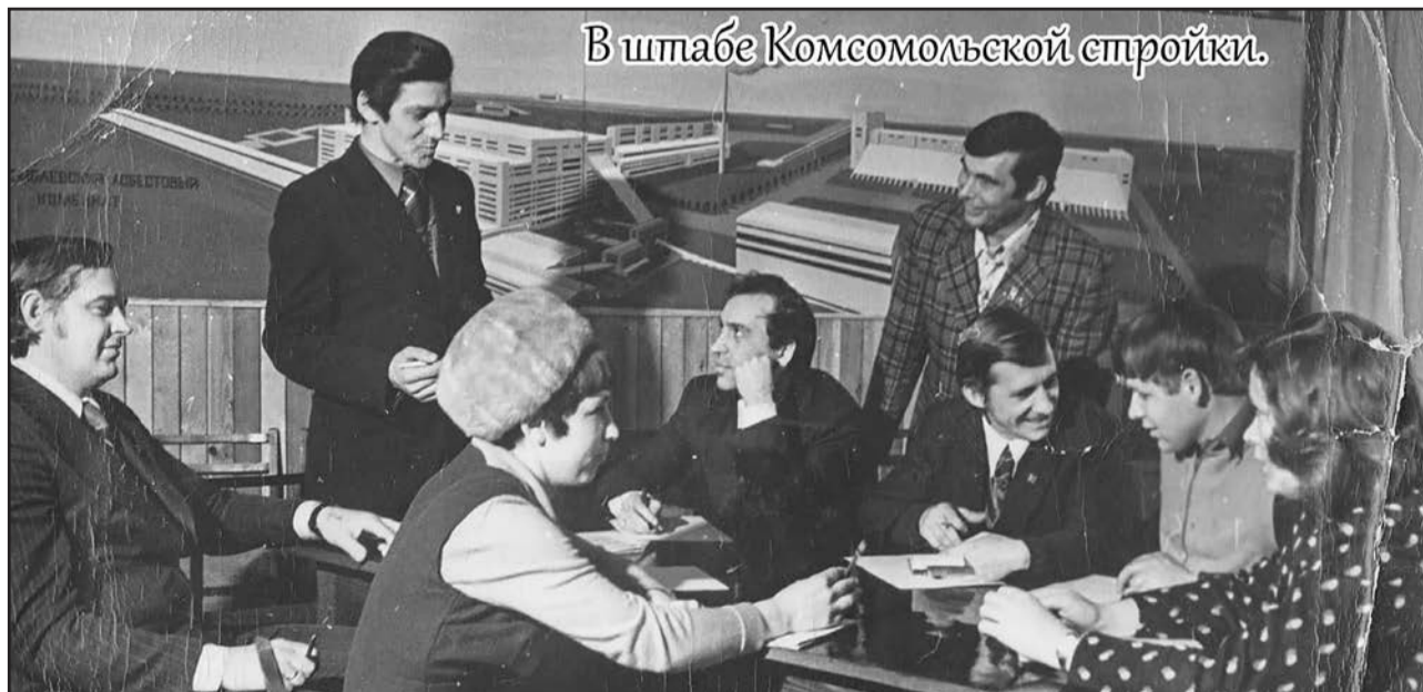
В штабе Комсомольской стройки.

Поколению семидесятых-восемидесятых можно позавидовать, они после себя оставили город и комбинат, который является гордостью Восточного Оренбуржья».