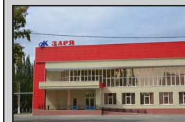
График работы бара: понедельник – выходной; вторник, среда, четверг, пятница, суббота, воскресенье – с 11.00 час. до 21.00 час.

В баре кинотеатра «Заря» вы можете отovarить свои талоны.