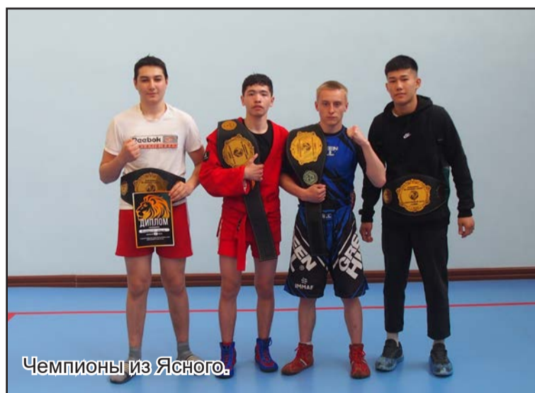
Чемпионы из Ясного.

Распространённая практика – заниматься различными видами единоборств одновременно. В боевом самбо выступили выходцы из ММА, вольной борь-