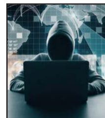
График проведения см. на 3 стр.

О преступности с использованием информационно-телекоммуникационных технологий.