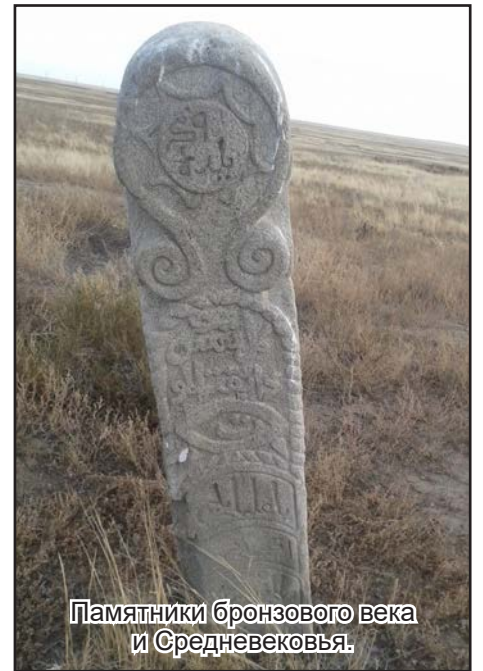
Памятники бронзового века и Средневековья.