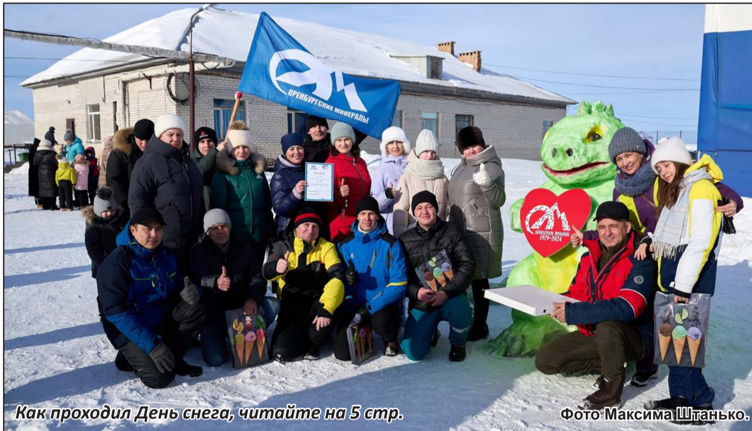
Как проходил День снега, читайте на 5 стр.

ВНИМАНИЕ! Мы запускаем конкурс детских рисунков на тему: «С юбилеем, любимый комбинат!» Подробнее на 6 стр.